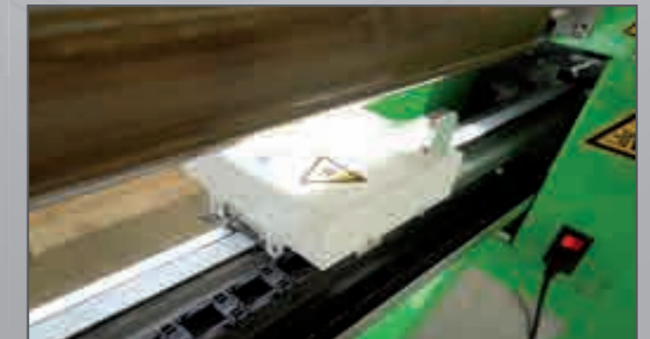
Abbildung: m-cat Messschlitten